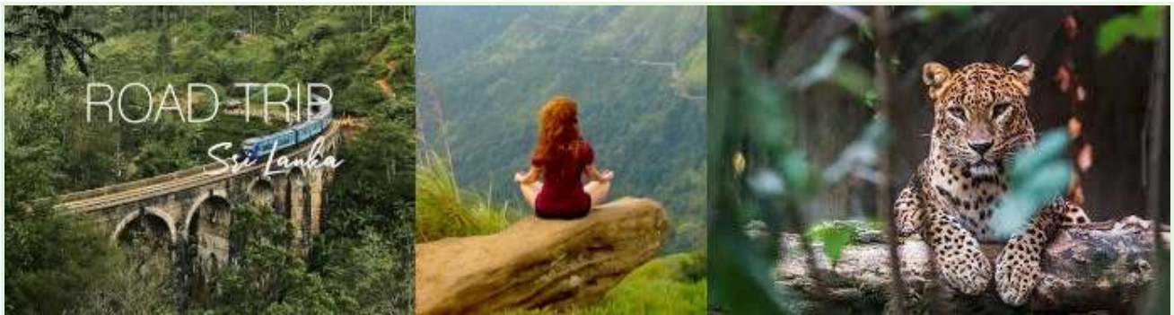
Vacances au Sri Lanka - Visites guidées et expéditions dans la nature

Calendrier : L'expérience a été lancée pendant la pandémie de COVID-19, alors que l'économie du Sri Lanka, dépendante du tourisme, était déjà gravement touchée.