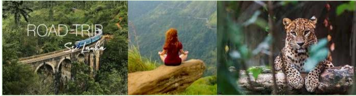
Vacanze in Sri Lanka - Visite guidate e spedizioni naturalistiche

Tempistica: l'esperimento è stato lanciato durante la pandemia di COVID-19, quando l'economia dello Sri Lanka, dipendente dal turismo, era già gravemente colpita.